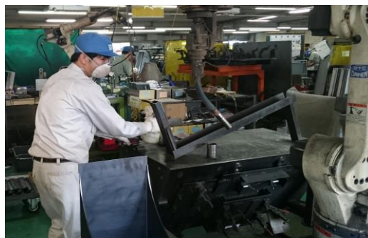
(高知工科大学システム工学群機械系 ****)

初日は、3つの工場を案内して頂きました。 2日目からは現場の実習、まず組立では出来上がった製品の出荷の様子や、製品の図面を見ました。 7-8事業部では、CADを使って図面を書いたり、現場でバラシ作業をしました。大学で旋盤の勉強をしていますが、機械を見るのは初めてで、2日間機械を操作させてもらい、とても貴重な体験となりました。溶接ロボットも体験しました。 今回のインターンシップ全体を通して感じたことは、モノづくりは楽しいということ、限られた時間の中で丁寧に作業していくことは難しく大変だということです。この経験を、今後活かしていけるよう頑張ります。