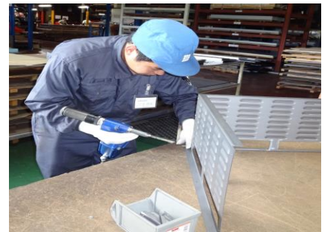
(高知工科大学システム工学群機械系 ****)

私は、大学で加工の理論を学んでいますが、実際の作業は高校の時少し体験をしたことがあります。今回のインターンシップで、加工の技術や作業について学びたいと考えていました。 部品を沢山作る場合、治具を使い時間短縮をし、加工が終わるまでの間に別の作業をしたりと、作業効率を考えながらやっているのだと感心しました。 今回の貴重な体験を、普段の生活や大学の研究活動に活かしていきたいと思えます。 大変お忙しい中、丁寧に指導して頂きありがとうございました。