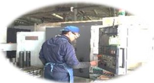
CNC旋盤 NL2500MC 森精機