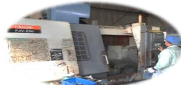
マシニング FJV-250 ヤマザキマザック