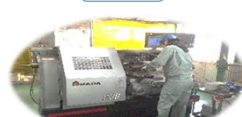
カスタム旋盤 CD-3 アマダマシニングツール