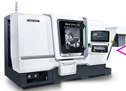
CNC旋盤（1台）森精機 DMG MORI NLX2500Y/700

X軸移動量 260mm Y軸移動量 ±50mm Z軸移動量 795mm 最大加工径 φ366mm 最大加工長さ 705mm