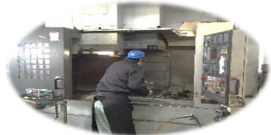
マシニング NV5000α1 森精機