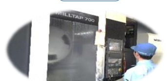
マシニング MILLTAP700 森精機

平成28年2月機械加工設備（マシニング3台・CNC旋盤1台）を新規に導入しました。これで従来の機械設備と併せると、マシニング6台・CNC旋盤2台・カスタム旋盤2台・汎用フライス盤2台等他となりました。これからも人材育成の継続には力を入れ、部品加工の受注拡大とともに、自社の強みでもあります一貫生産（設計～組立・完成品）、また更なる組立の短期対応を目指し、社員一同一丸となり、皆様の期待に応えられるように邁進して参ります。今後ともよろしくお願い致します。