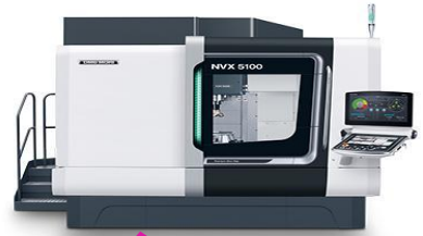
立形マシニングセンタ（2台）森精機 DMG MORI NVX5100/50

X軸移動量 260mm Y軸移動量 ±50mm Z軸移動量 795mm 最大加工径 φ366mm 最大加工長さ 705mm