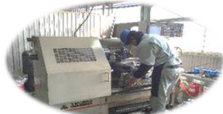
カスタム旋盤 C-3 テクノフジノ