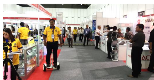
(デルタマス 機械工作展)