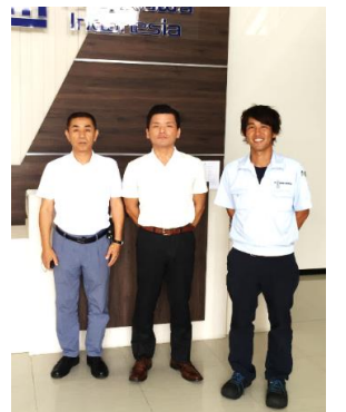
ツジカワ インドネシア工場 (山崎・鈴木) (案内役 江川様)