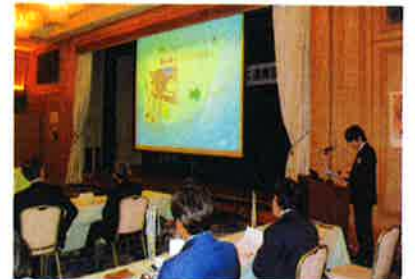
(設計開発部 係長 *** **)